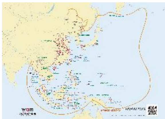
【2】カラー(網掛けなし)